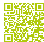
JAV-Praxis: G- und K-JAV